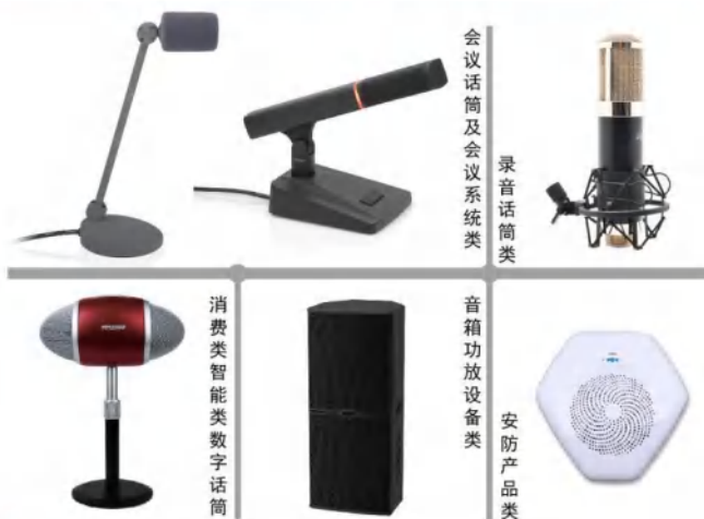
会议话筒及会议系统类 录音话筒类

七九七音响拥有市级技术研发中心、先进的电声测试实验室、北京市声学检测站、完善的科研设备及多套高端综合制造设备，拥有40000多平米的国际标准厂房。公司拥有由多名行业资深专家、博士、大批高级工程师组成的研发团队，与中国传媒大学、南京大学开展合作，建立声学产学研基地。