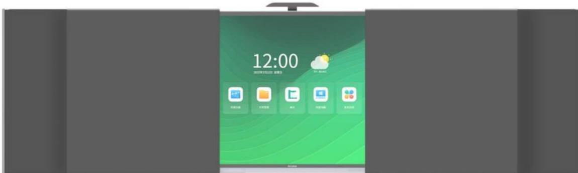
智慧黑板Q系列搭配移动副板形态