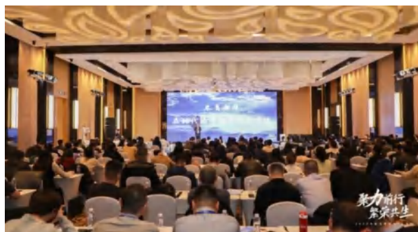
北京站·希沃 2023 年新品推介会

“教学过程数字化”和“教师发展数字化”、“教学资源数字化”、“教育管理数字化”等来赋能教师、学生成长和学校发展。希沃通过推出多种产品，如交互智能平板、音视频智能终端、教育商用计算机等，不断推动教室环境的数字化。这些产品不仅覆盖了显示、音视频采集处理，还涉及教师办公室和教学周边设备，形成全方位教育信息化解决方案。