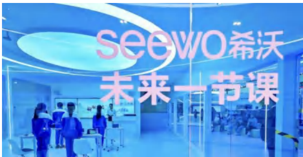
希沃未来教育创新日开启希沃教学大模型内测

此外，希沃数字魔方基座搭建区域数据治理平台、课堂资源管理平台等，助推教育治理数字化。希沃精品录播开展“三个课堂”，生成名校网络课堂、名师课堂、专递课堂，助力教育优质均衡发展。